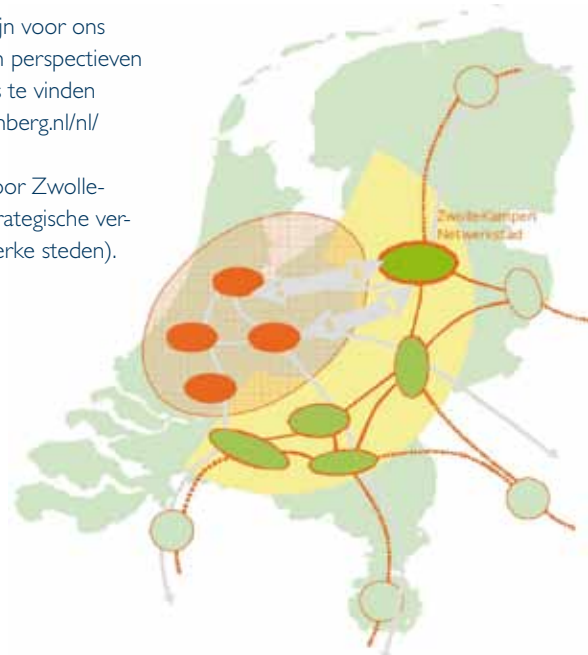
Zwolle-Kampen als schakel in de mid size ring

Op basis van deze principes zijn voor ons gebied verschillende ideeën en perspectieven ontwikkeld. Het eindrapport is te vinden op: http://www.zandbeltvandenberg.nl/nl/projecten/p/mid-size-utopia De resultaten van de studie voor Zwolle-Kampen zijn verwerkt in de strategische verkenning (zie programmalijs Sterke steden).