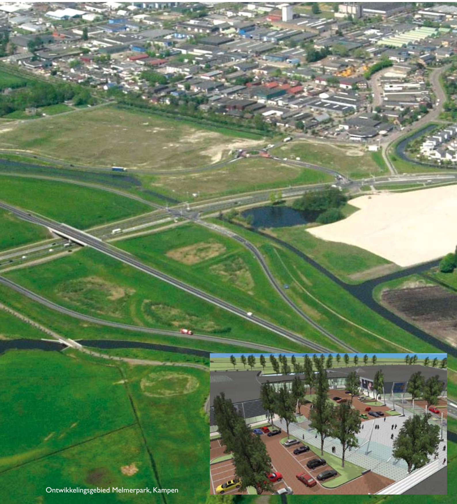
Ontwikkelingsgebied Melmerpark, Kampen