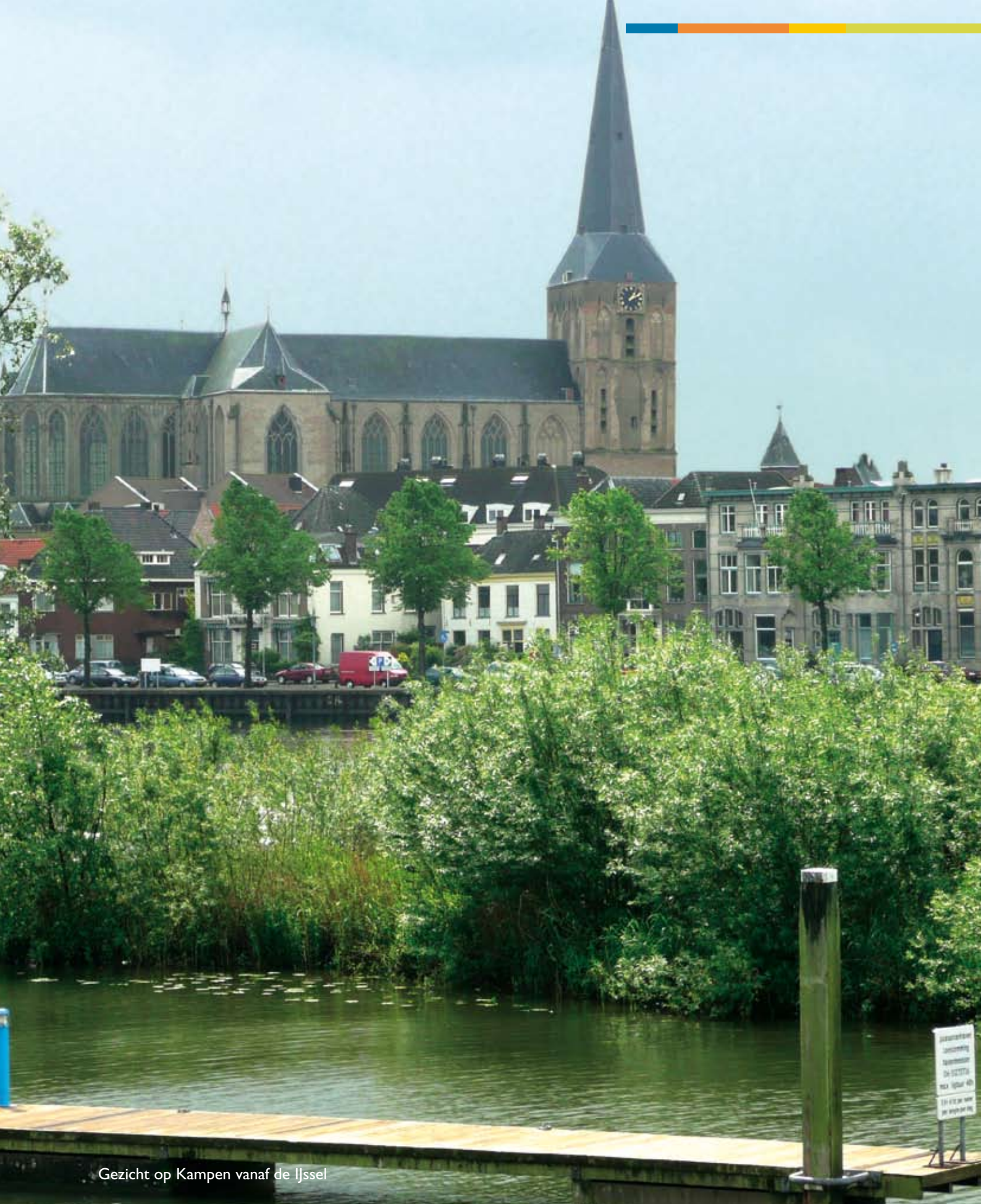
Gezicht op Kampen vanaf de IJssel