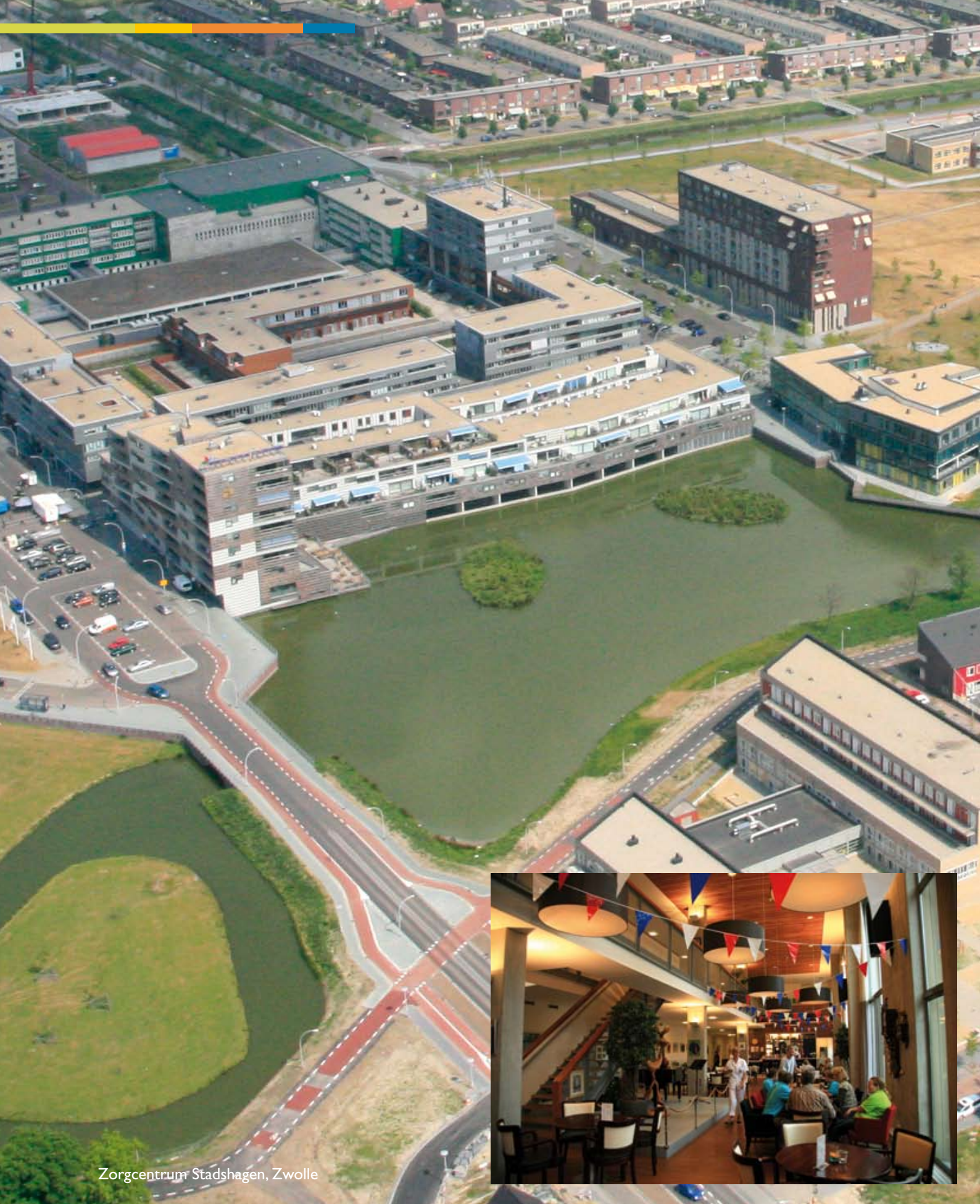
Zorgcentrum Stadshagen, Zwolle