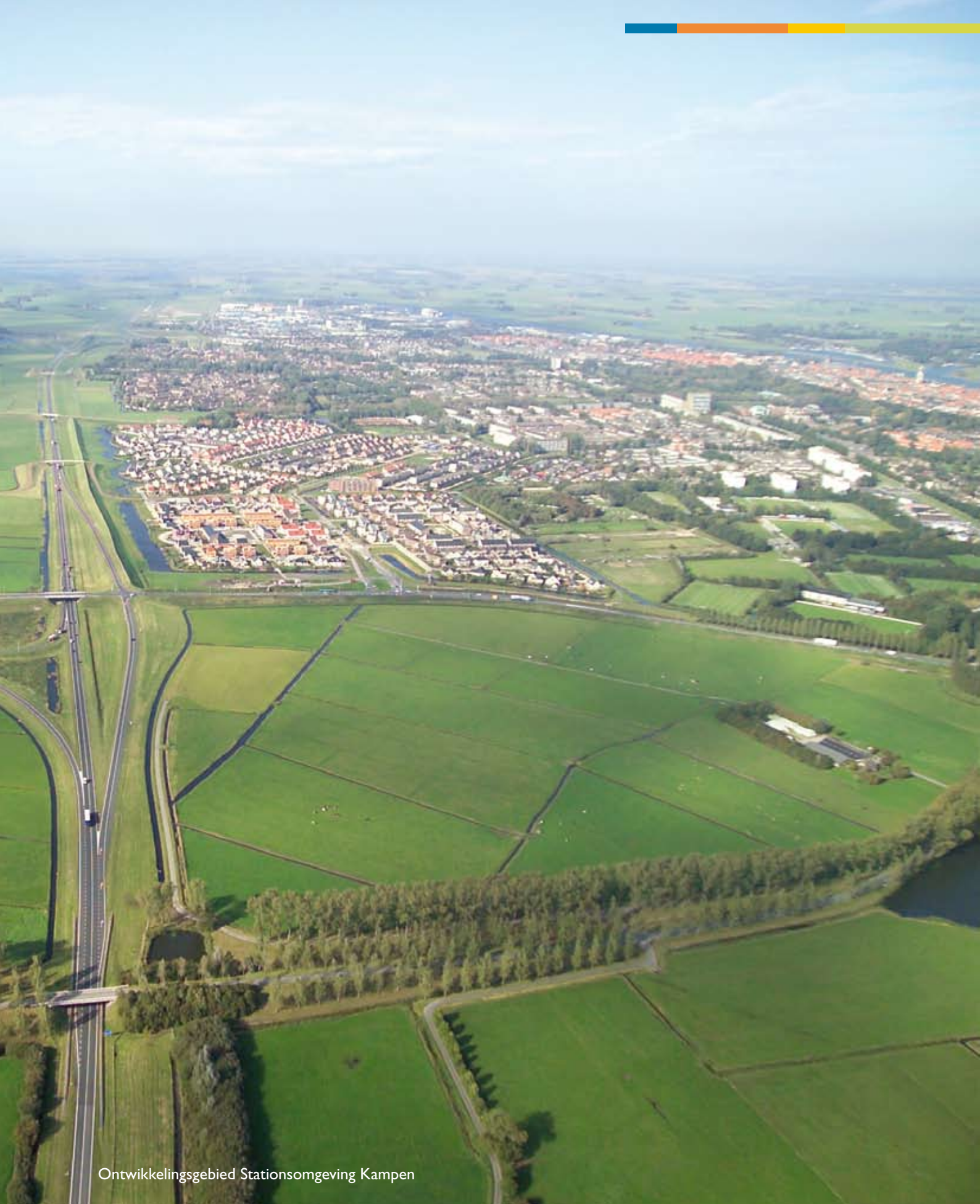
Ontwikkelingsgebied Stationsomgeving Kampen