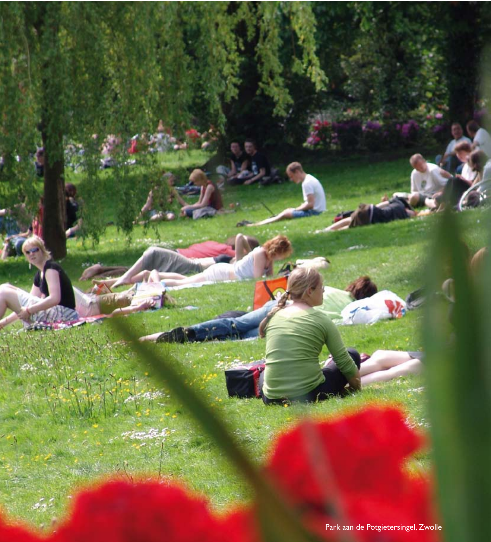
Park aan de Potgietersingel, Zwolle