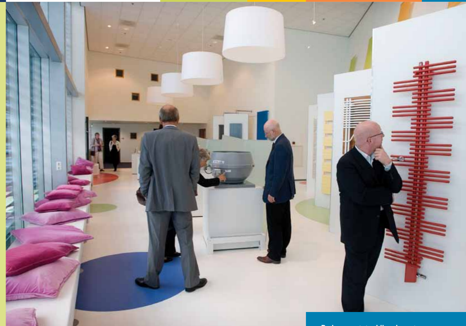
Raden- en statenbijeenkomst Vernieuwende Economie