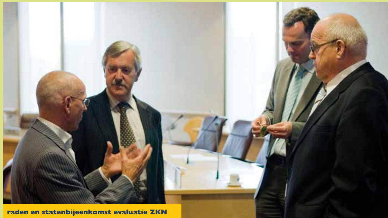
raden en statenbijeenkomst evaluatie ZKN

om ZKN. Naast deze voornemens gaan wij de komende tijd investeren in externe contacten om gezamenlijk met alle partijen (bedrijven, inwoners etc.) te werken aan het behalen van de doelstelling van ZKN. Daarnaast zullen wij de interne samenwerking tussen de drie organisaties verder uitwerken met als doel elkaar leren kennen, delen van leermomenten en het opdoen van nieuwe ideeën. Dit kan bijvoorbeeld door het organiseren van masterclasses maar ook door uitwisselingen van medewerkers. Een mooie vorm om elkaar te versterken.